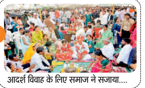
आदर्श विवाह के लिए समाज ने सजाया....